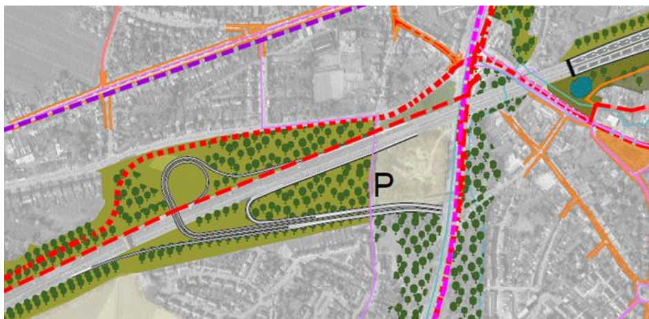
Schets nieuw complex te Kraainem op de E40.

Bovendien zal er sterke filevorming zijn op de R22 om die oprit te vervoegen.