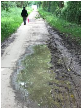
Foto 4: Afgevalen takken na de storm worden niet onmiddellijk verwijderd.

Foto 3 : Tijdens de ochtendspits rijdt er hier 1 fietser om de 20 seconden. Mekaar kruisen is zeer moeilijk.